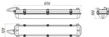
Рисунок 1 Светильник «L-sub 45»

1.5 Общий вид и габаритные размеры светильника показаны на рисунке 1.